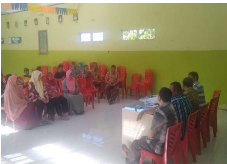
Uji petik kelurahan Tenilo Oktober 2019