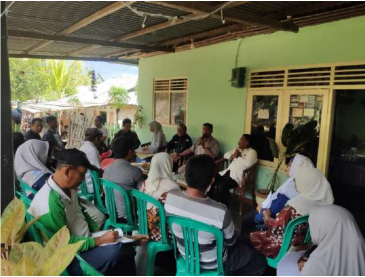
Uji petik kelurahan Bongohulawa Tanggal 17 Oktober 2019