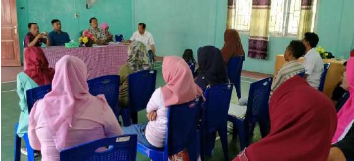
Uji petik kelurahan Bolihuangga Tanggal 10 Oktober 2019