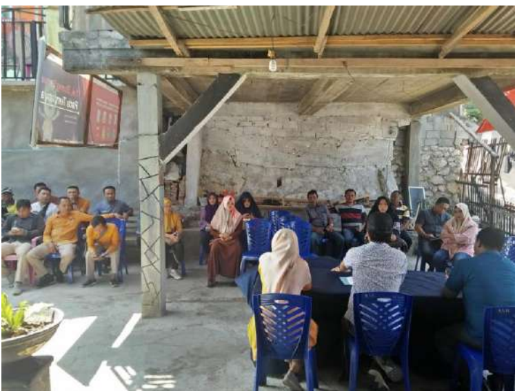
Uji petik kelurahan Dembe I Tanggal 17 Oktober 2019