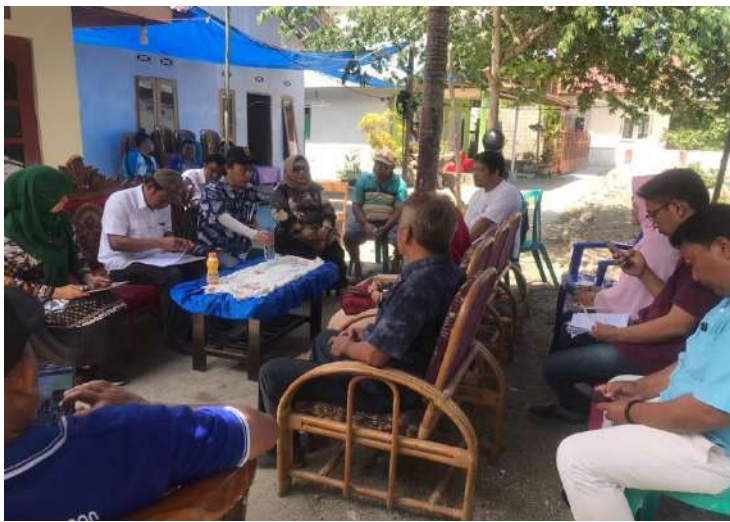
Uji petik kelurahan Limba B Tanggal 18 Oktober 2019