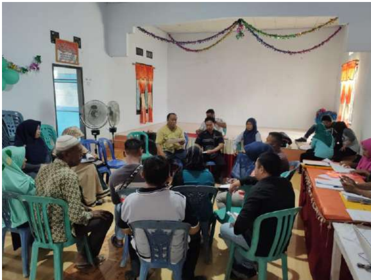
Uji petik kelurahan Tilihuwa Tanggal 11 Oktober 2019